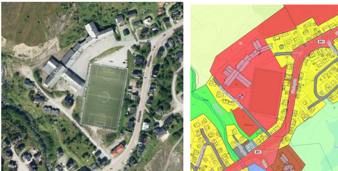
Området rundt Båtsfjord skole - ortofoto og kommuneplanens arealdel

Området er i gjeldende kommunedelplan for Båtsfjord tettsted (2004-2008) avsatt til nåværende offentlige bygninger (S7), boligområder (B13), vegareal, friområde (F12) og LNF-område (L2).