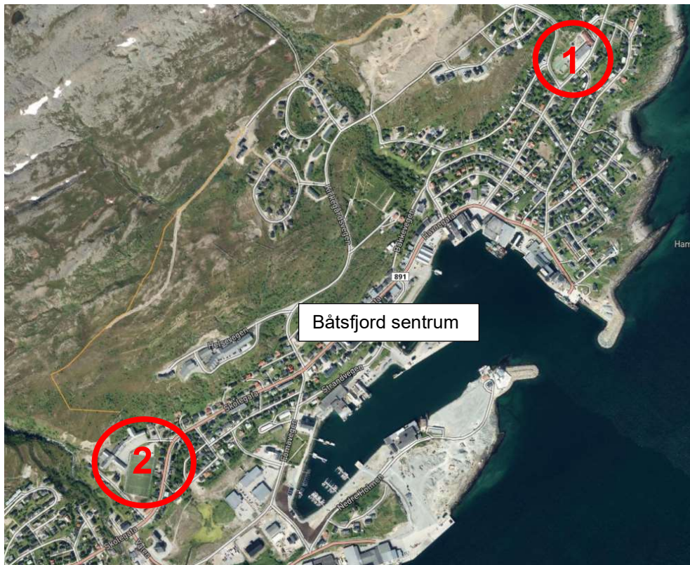
Lokalisering av områdene for hhv. barnehage (1) og skole (2) som reguleres.

I henhold til plan- og bygningsloven § 12-3 og 12-8 kunngjøres det oppstart av detaljregulering av to områder i Båtsfjord sentrum på vegne av Båtsfjord kommune. I henhold til pbl. § 1-7 og § 12-15 varsles det også at det kan bli felles plan- og byggesaksbehandling for tiltakene. Reguleringsplanene følges av kommunens prosjekt «Samlokalisering av kommunale tjenester i Båtsfjord kommune» og vil planlegges parallelt da de har sammenfallende tidsplan for flytting av funksjoner.