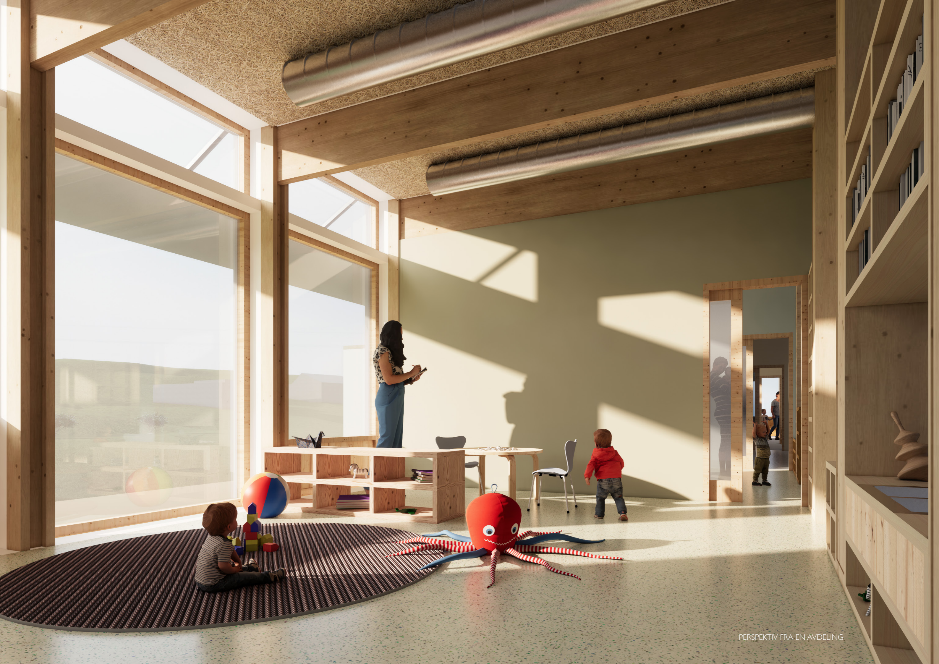
PERSPEKTIV FRA EN AVDELING