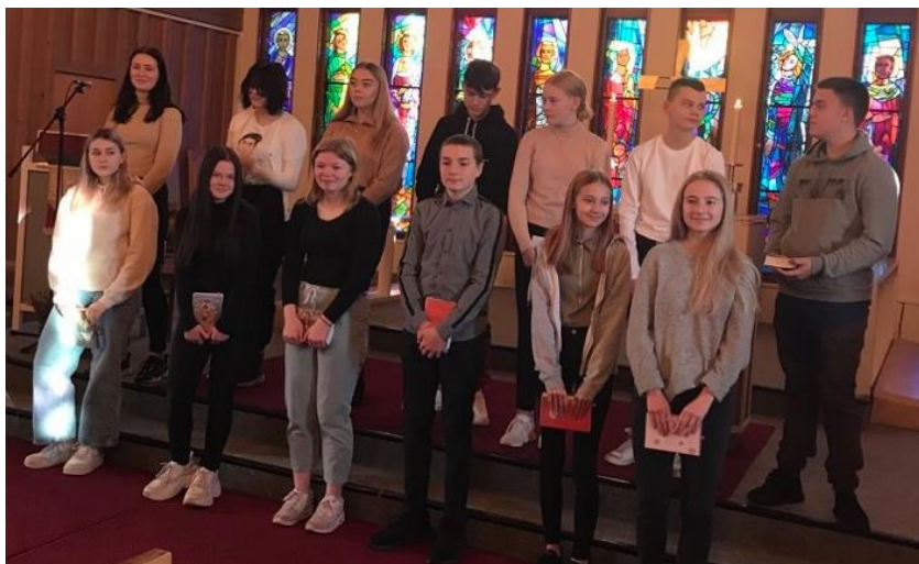
Foto fra presentasjons- gudstjenesten 18.10.2020

2021 konfirmantene måtte vente med oppstart av konfirmantåret sitt til høstkonfirmasjonene av 2020 konfirmantene var unnagjort. Presentasjonsgudstjeneste ble derfor gjennomført først 18.okt 2020.