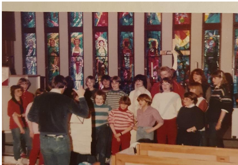
Bildene er fra siste øvelse før Finnmarksturneen i juni 1982.