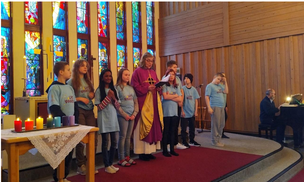
Bildet ovenfor er fra Tårnagentenes deltakelse i gudstjenesten 20.mars

Dessverre er ikke neste overnattingsmulighet før de eventuelt velger å være konfirmanter i Båtsfjord kirke det året de går i 9.klasse